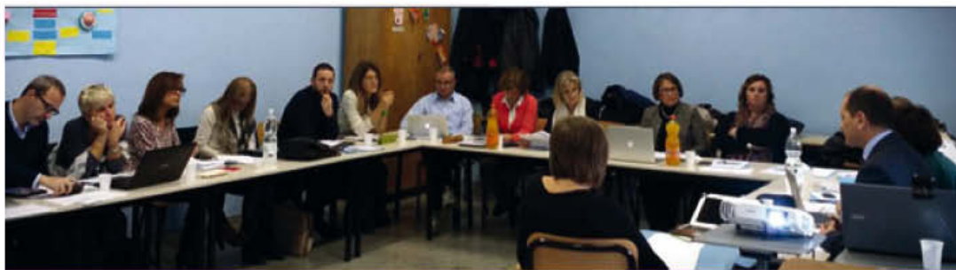
Riunione di Rete Dialogues, IC Settembrini Roma, 12 novembre 2015

È a disposizione un HELP DESK TECNICO che risponde ai quesiti, chiarisce dubbi ed eventuali incertezze, risolve problemi, supporta l'iscrizione degli alunni alla piattaforma Face to Faith (corso team blogging) e collabora per la messa a punto del setting tecnico della videoconferenza. helpdesk@retedialogues.it