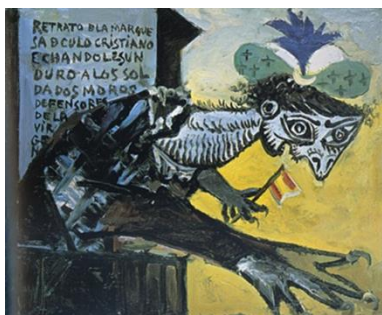
Figura femminile ispirato alla guerra di Spagna 19 Gennaio 1937 -ESPOSTA PER LA PRIMA VOLTA-

Attraverso un corpo espositivo di più di 150 opere tra olii, ceramiche, disegni, serigrafie, fotografie e incisioni per raccontare l'ecletticità del genio incontrastato del '900. E' un excursus completo intorno a tutti i temi cari al più Grande Pittore del nostro secolo fatta dei personaggi pittoreschi della Barcellona giovanile tanto da lui amata, la forza espressiva del rapporto con il Teatro e delle epoche della Parigi de l'age d'or, oltre che ovviamente al suo rapporto con la figura della modella spesso evidenziato da una forte carica erotica. Inoltre, farebbero parte della mostra anche le rarissime opere del suo periodo più realista ossia quello dell'epoca blu.