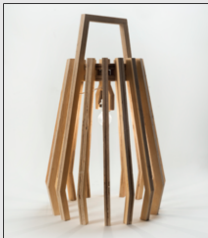
Collezione aperta C103 - lampada - progetto di Margherita Pappalardo, docente Vittorio Venezia.