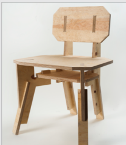
Collezione aperta Seggiola – seduta - progetto di Vittorio Venezia.

Il corso di laurea triennale in Product Design e Comunicazione Visiva fornisce competenze specifiche nel disegno industriale e nelle discipline legate alla progettazione dello spazio, come il design d'interni e di allestimenti, affiancando ad esse anche fondamentali di graphic design. L'obiettivo è formare progettisti versatili, capaci di seguire